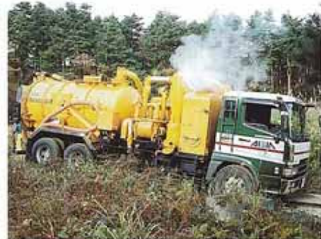
高圧吸泥車 (パワープロベスター)

環境メンテナンスサービスでは、排気クリーニング設計の高圧吸泥車による汚泥吸引や道路側溝清掃などのクリーニング作業の場で活躍しています。高圧下水管洗浄車による作業においては、下水管の洗浄をはじめ、化学工業・セメント工場・ビル排水管等で幅広く活用されています。