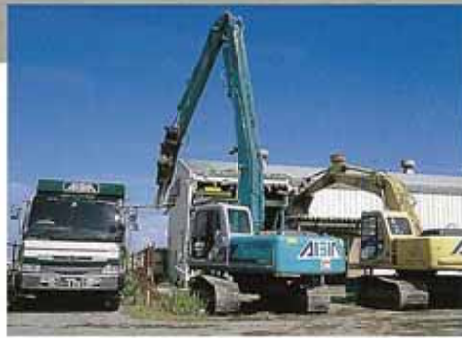
帝国石油解体作業

環境衛生事業部(リサイクルセンター)事務所。環境メンテナンス車輛、左から大型吸泥車・散水車・洗浄車・吸泥車・バトロール車。