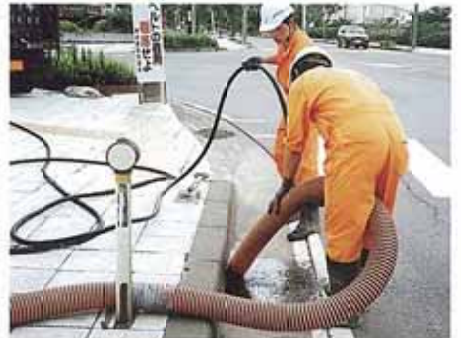
道路側溝清掃作業